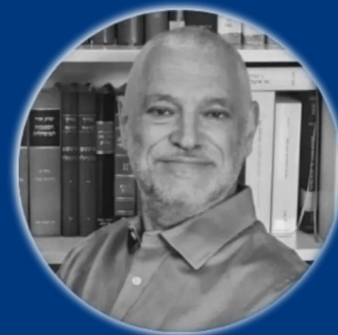
פרופ' עומר דקל